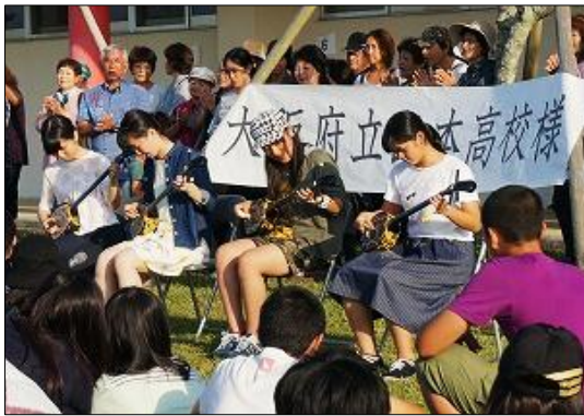
↑教わった三線を披露する(退村式)

2日目(10月29日) この日は民泊先のご家庭でいろいろな体験をしました。農作業の手伝い、島の観光スポット巡り、沖縄のお菓子作り、三線体験・・・などなど、それぞれの農家のお父さんお母さんが考えてくれたメニューで島の生活や人々と触れ合いました。夕方に羽地公民館に集合、退村式を行いました。たった1日でしたが、民泊先のお父さんお母さんやご家族の方との絆は確実に深まったようです。別れを惜しみながら、ホテルに移動し、2日目は終了です。