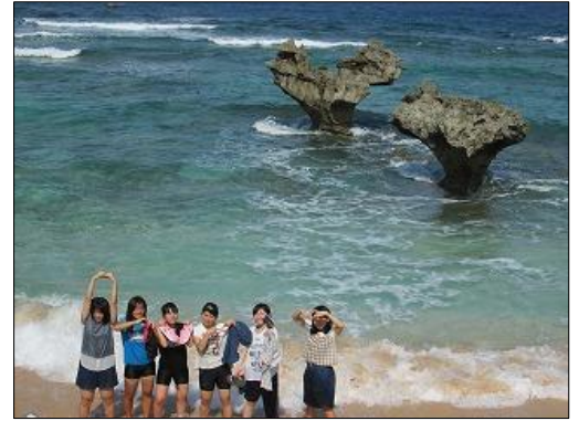
↑古宇利島の観光スポット「ハートロック」

1日目(10月28日) 伊丹空港から大阪を出発。沖縄那覇空港には昼前に到着。全員で昼食後、バスに揺られて古宇利島に到着し、古宇利大橋やオーシャンタワーからの絶景を楽しんだ後、クラス写真撮影をしました。その後、公民館で民泊の入村式を行いました。沖縄踊りの見学、生徒代表挨拶のあと、お世話になる農家のお父さんお母さんと対面し、71軒のおうちに分かれていきました。